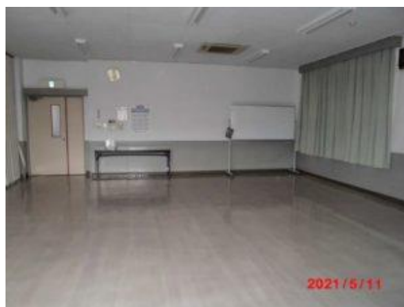
【会議室3】 利用可能人員35～45人 壁鏡有り