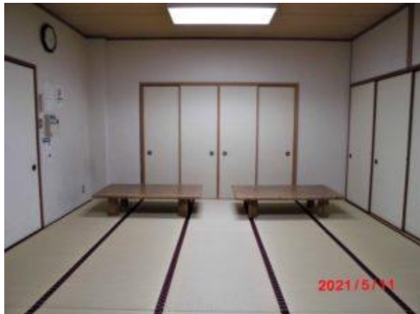
【和室3】 利用可能人員20～25人 座卓：3台 15畳敷