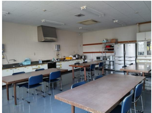
【調理室】 利用可能人員30～40人 机：4台 椅子16脚 調理設備有り