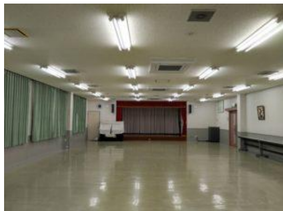
【ホール】 利用可能人員90～110人 長机：75枚 椅子：85脚