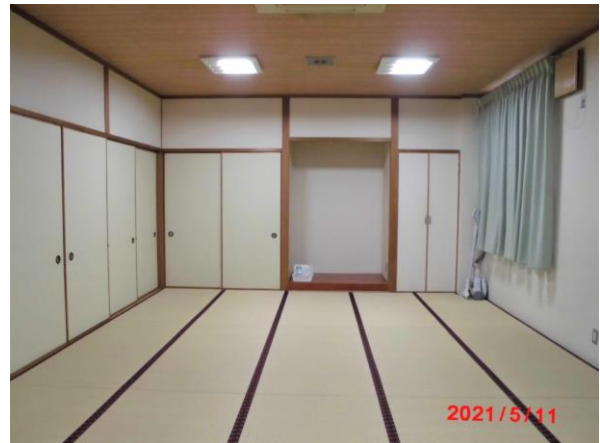
【和室4】 利用可能人員25～30人 座卓：11枚 20畳敷