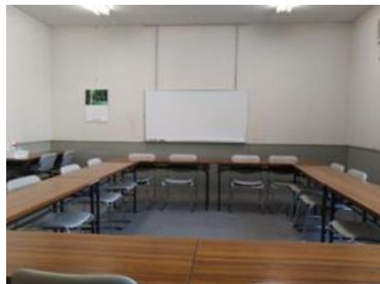
【会議室1】 利用可能人員25～30人 長机：9枚 椅子：18脚