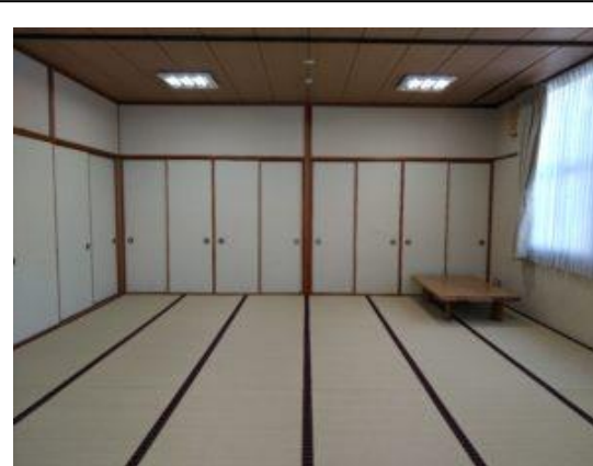
【和室2】 利用可能人員30～35人 座卓：15枚 24畳敷