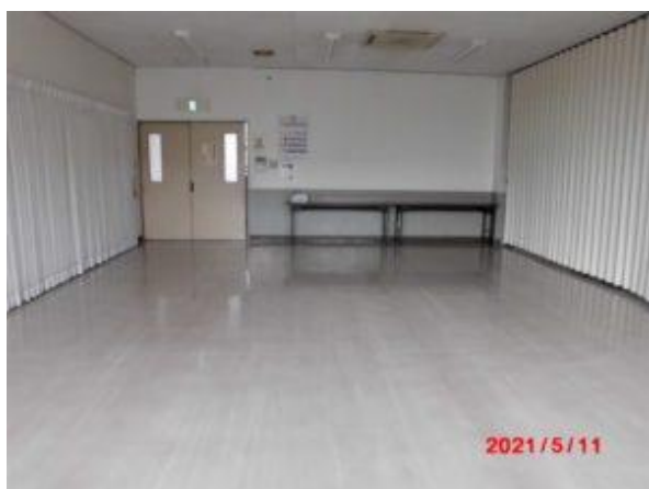
【会議室2】 利用可能人員40～50人